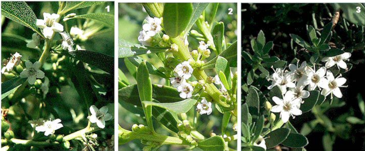
Flores de 1. M. laetum , 2. M. insulare , 3. M. parvifolium

Existe un confusiónismo muy grande entre varias especies dado su enorme parecido y porque son plantas variables, reproducidas por esquejes, de las que se desconoce su procedencia, por lo que en muchos de los casos no responden a las características de la especie típica (G. López González 2001). De acuerdo al material que hemos examinado hemos llegado a la conclusión, con algunas reservas, que son 3 las especies en cultivo, M. laetum G.Forst., M. insulare R.Br. y M. parvifolium R.Br., y que las citas de M. tetrandrum (Labill.) Domin y M. serratum R.Br., que son sinonimias, se refieren a M. insulare R.Br., y las citas de M. verrucosum Poir., M. acuminatum R.Br. (al menos en parte) y M. tenuifolium G.Forst. se refieren a M. laetum G.Forst.. Hemos de reconocer que el material que englobamos bajo M. laetum G.Forst. es variable en cuanto al tamaño de la flor, la forma y textura de las hojas y la mayor o menor apariencia a simple vista de sus glándulas translúcidas, lo que nos llevó en trabajos anteriores a considerar parte de ese material como M. acuminatum R.Br., especie muy variable cuya presencia aún no descartamos.