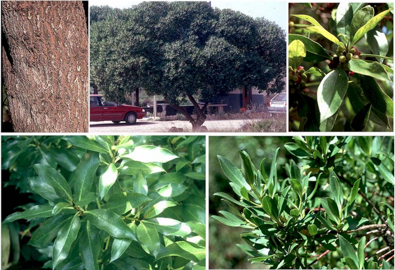
Arriba: M. laetum , corteza, aspecto general y detalle de los frutos. Abajo: detalle de las hojas de M. laetum y de M. insulare

W. Rodger Elliot, W. & David L. Jones (1993) Encyclopaedia of Australian plants suitable for cultivation. vol. 6. Lothian Book.